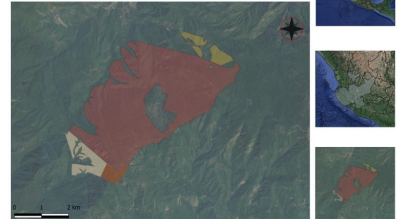
Contingencia Fitosanitaria por defoliador mosca sierra ( Zadiprion falsus y Neodiprion sp.) en la Reserva de la Biosfera Sierra de Manantlán, Jalisco-Colima